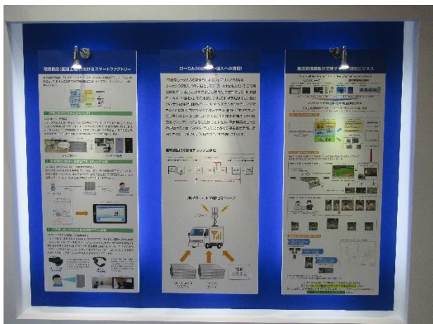
▲ユースケースコーナー