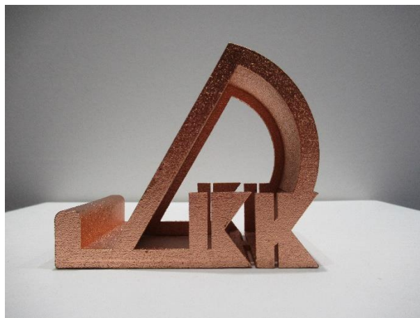
▲ 3D プリント造形技術を用いた DKK ロゴ