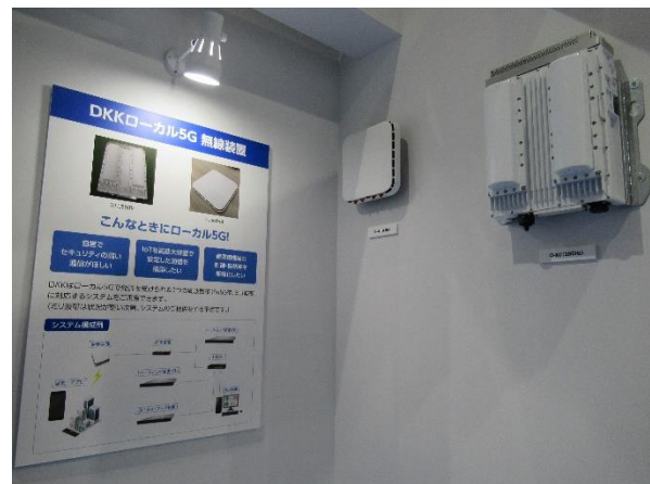
▲ローカル 5G 無線装置